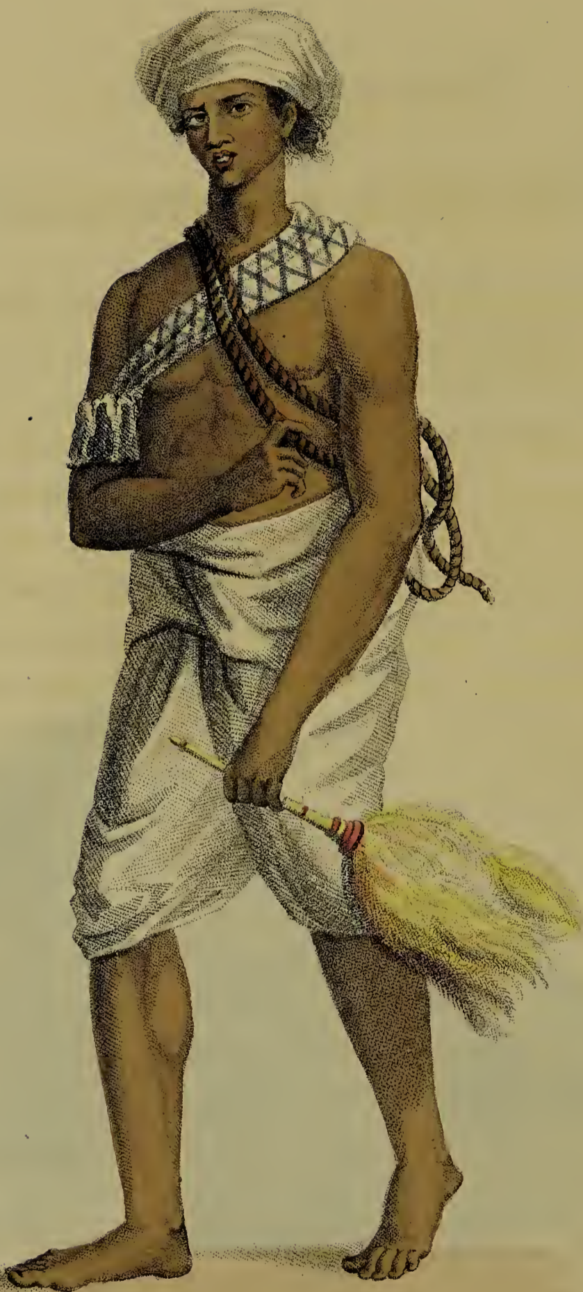
Painted by Solingna Bona Calcutta.